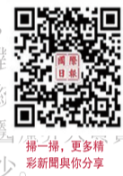
掃一掃，更多精彩新聞與你分享

韓聯社援引韓國保健福祉部數據報道，截至20日深夜，韓國已有100家醫院的8816名實習醫生和住院醫生遞交了辭職報告，占上述醫院實習和住院醫生總人數的71.2%，其中7800